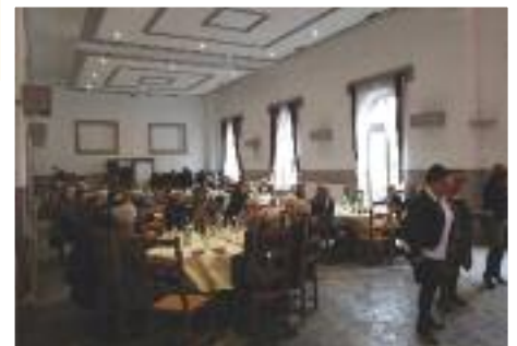
Repas des séniors