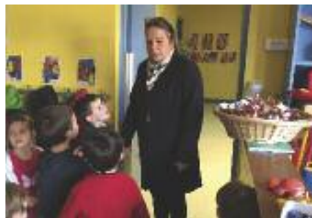
Noël à l'école