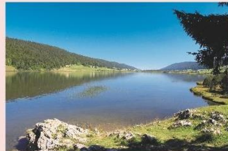
Le lac des Rousses

Le programme d'activités est donné à titre indicatif et est susceptible d'être aménagé selon les conditions météorologiques ou la disponibilité du prestataire. Le programme détaillé sera transmis aux organisateurs au plus tard 7 jours avant le début du séjour. Piscine chauffée à disposition, n'oubliez pas votre tenue de bain!