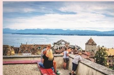
Nyon et son lac